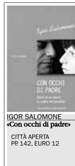
IGOR SALOMONE «Con occhi di padre» CITTÀ APERTA PP 142, EURO 12

Ai genitori alle prese con bambini piccoli che la sera faticano a prendere sonno Salani dedica infine «E tutti fan la nanna. Consigli e rimedi quando i vostri bambini non dormono» di Tamara Eberlein (200 pagine, 12 euro). Un libro molto utile che raccoglie il frutto di un lungo lavoro di ricerca e tante testimonianze di genitori che hanno vissuto il problema in prima persona.