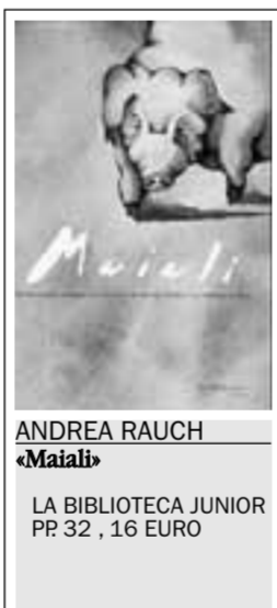
ANDREA RAUCH «Maialib» LA BIBLIOTECA JUNIOR PP 32, 16 EURO

Tra le novità della casa editrice Biblioteca Junior, fuina di libri di qualità, soprattutto albi illustrati, rivolti in particolare ai lettori più giovani, c'è un altro titolo molto interessante e originale sia per quanto riguarda la storia, sia per le illustrazioni: è «Il clown dottore» di Dedieu Thierry (pp. 20, 13 euro). Racconta la dolce storia di Pippo, un clown che lascia la scena del circo per andare negli ospedali a portare gioia e sorrisi ai bambini malati; e di Doug, un bambino malato di leucemia che di sorridere proprio non ne vuole sapere. Un incontro tenero tra due generazioni diverse, che si snoda attraverso tanti piccoli e grandi eventi, finché la situazione si rovescia ed è Pippo ad avere bisogno di avere qualcuno vicino che lo faccia sorridere e lo aiuti a guarire. In primo piano un invito ai piccoli lettori a puntare l'attenzione su valori importanti come l'amicizia e il desiderio di aiutare e gli altri, soprattutto i più deboli.